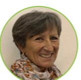
Nadine GRILLON Saint-Laurent-du-Verdon Maire