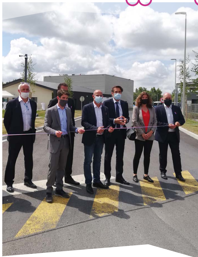
Les élus et les partenaires lors de l'inauguration du dépôt de bus à Manosque.