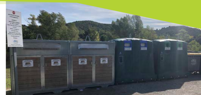
Points d'apport volontaire (PAV)

DLVA bénéficie pleinement de la proximité du CEA (Commissariat à l'énergie atomique et aux énergies alternatives) de Cadarache, et du projet international ITER.