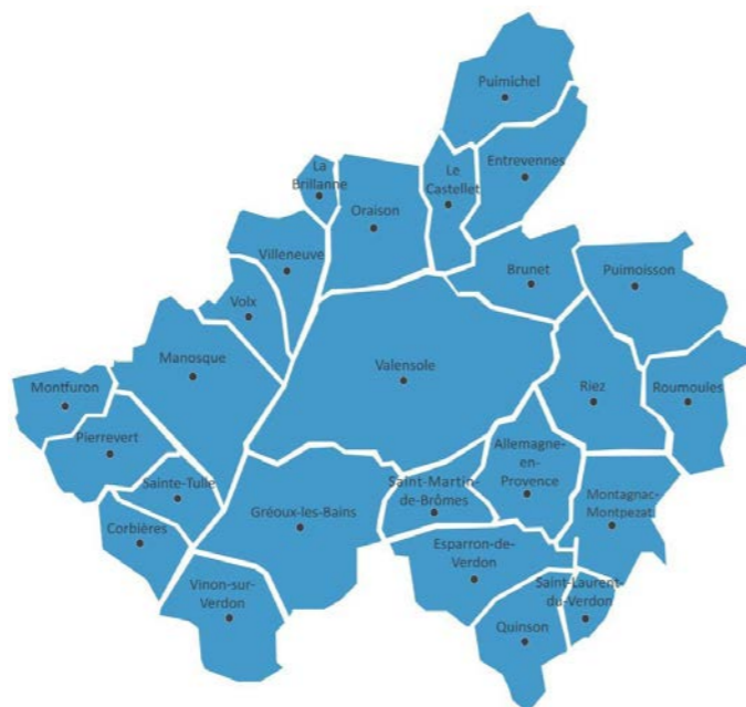
Carte du territoire

D DLVA, signifie « Durance Luberon Verdon Agglomération ». C'est une communauté d'agglomération, c'est-à-dire un « Établissement public de coopération intercommunale » (EPCI), qui regroupe 25 communes. 24 sont situées dans les Alpes-de-Haute-Provence et une (Vinson-sur-Verdon) dans le Var. Le territoire de DLVA a une superficie de 846 km 2 et compte 62 000 habitants, soit près de 40% de la population du département de Alpes-de-Haute-Provence.