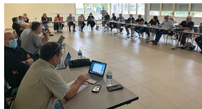
Session du Conseil Communautaire